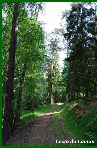
Cesta do Loman