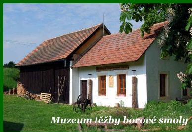
Muzeum těžby borové smoly